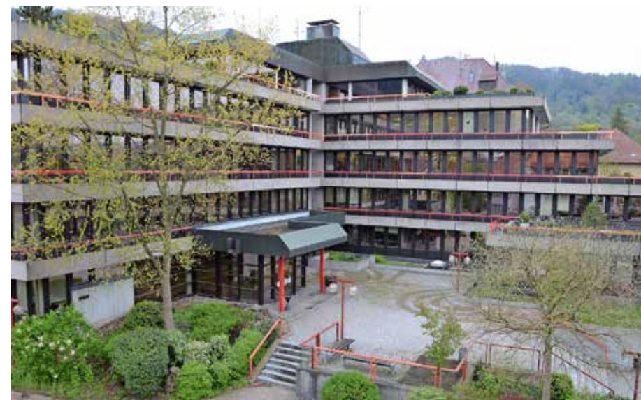
Landratsamt des Hohenlohekreises.

Allee 17 | 74653 Künzelsau Tel. 07940 18-747 susanne.walz@hohenlohekreis.de www.hohenlohekreis.de