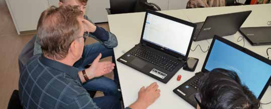
Computerhilfe bei CafeKÜSS.

Bahnhof müssen. Sie brauchen aber einen Zugang zum Internet. Beratung und Hilfestellung dazu geben gerne Mitglieder des Vereins der Künzelsauer Seniorinnen und Senioren im Rahmen Ihrer Medienberatung im CaféKÜSS. (Siehe S. 38)