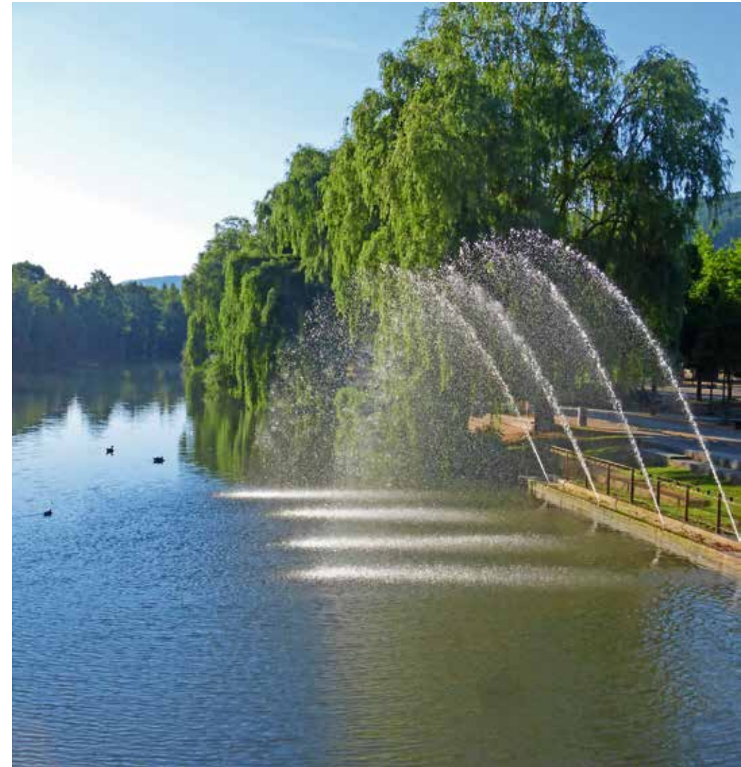
Künzelsau, die Stadt am Fluss.

GEMEINSCHAFTSPRAXIS | Dres. Christian & Maximilian Wirsching Amrichshäuser Str. 42 | 74653 Künzelsau | Telefon 07940 937272 info@wirsching-zahnaerzte.de | www.wirsching-zahnaerzte.de