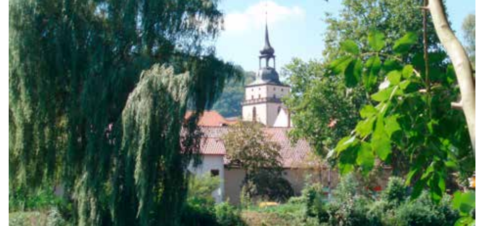
Die Johanneskirche, Wahrzeichen der Stadt.