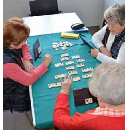
Spiele im CaféKÜSS.

Jeweils einmal im Monat, immer am Donnerstag, 14.00 bis 16.00 Uhr im ev. Gemeindehaus Kocherstetten gemütliches Beisammensein mit guter Unterhaltung und anregenden Themen, oft mit Referenten. Betriebsbesichtigungen und Ausflüge gehören mit zum Programm.